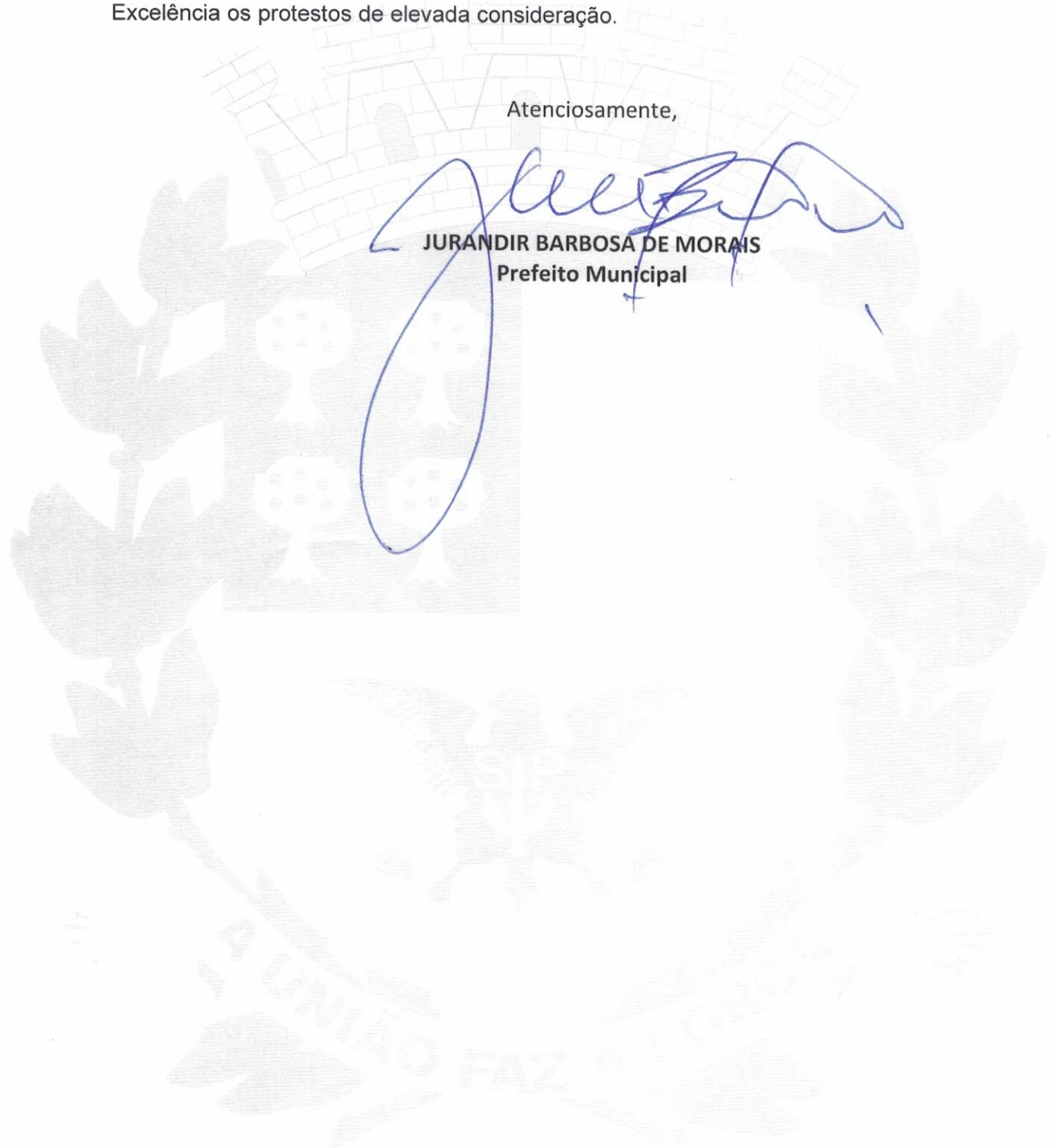
JURANDIR BARBOSA DE MORAIS Prefeito Municipal