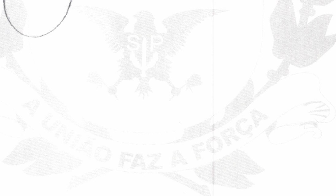
JURANDIR BARBOSA DE MORAIS Prefeito Municipal