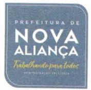
JURANDIR BARBOSA DE MORAIS Prefeito Municipal